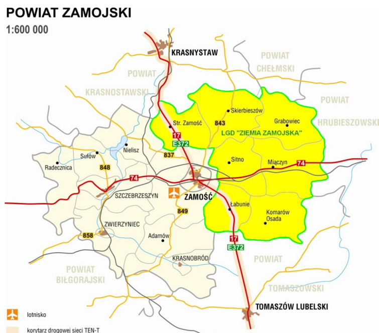
Mapa 2. Spójność przestrzenna obszaru LGD „Ziemia Zamojska”